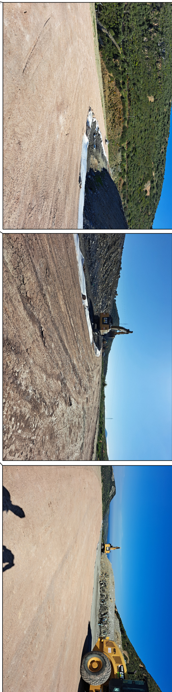
Canaletta in lamiera zincata Ø120cm